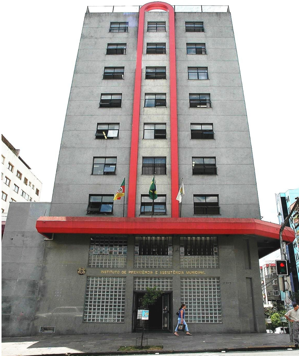
Caxias do Sul - RS