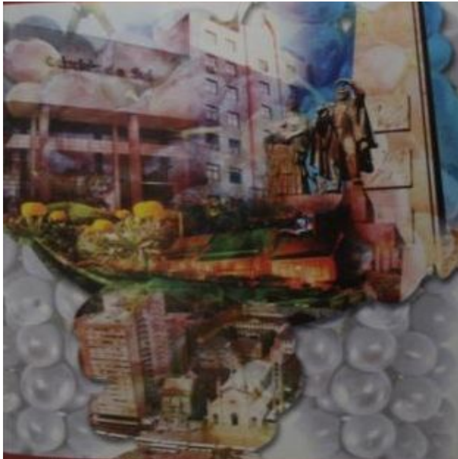
Caxias do Sul - RS